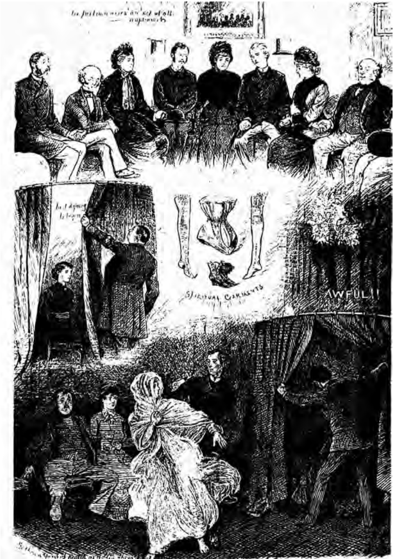
Ghost grabbing in stripverhaal-vorm; het bijschrift bij het eerste plaatje luidt: The preliminaries are not at all unpleasant. [De voorbereidingen zijn in het geheel niet onaangenaam.] Het medium is Florence Cook (volgens sommigen).