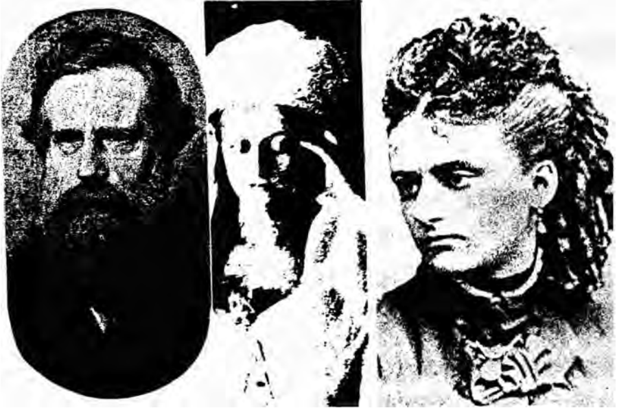
William Crookes, 'Katie King' en Florence Cook

hangen. De dreiging werd wat minder toen iemand tijdens een seance van Florence Cook in januari 1880 een greep naar de geestverschijning deed en opnieuw het spartelende medium in zijn handen bleek te houden.