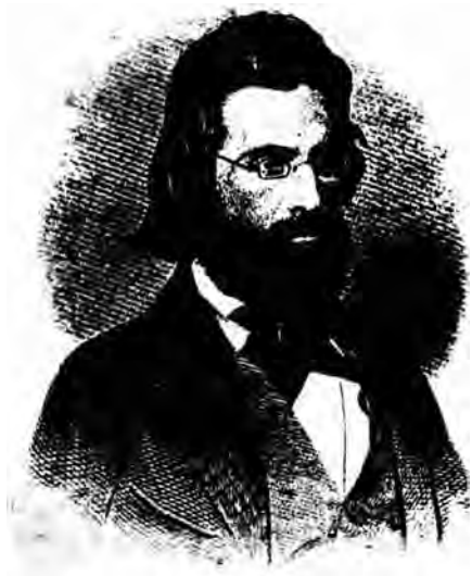
Andrew Jackson Davis

nieuwigheden als geheimzinnige geluiden, heerlijke geuren en zwevende, lichtgevende handen kunnen produceren. Ondanks de rivaliteit werd er ook wel samengewerkt. Er circuleerden brochures waarin de laatste technische snuffjes te koop aangeboden werden, men ging bij elkaar in de leer en gaf informatie over belangrijke klanten door.