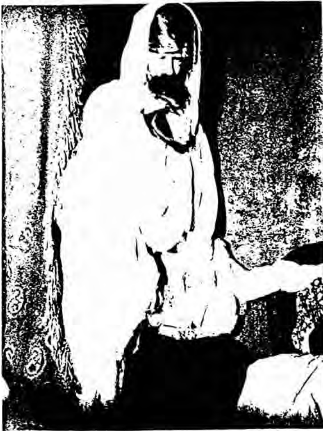
De geest van Bien Boa verschijnt uit het kabin Yf