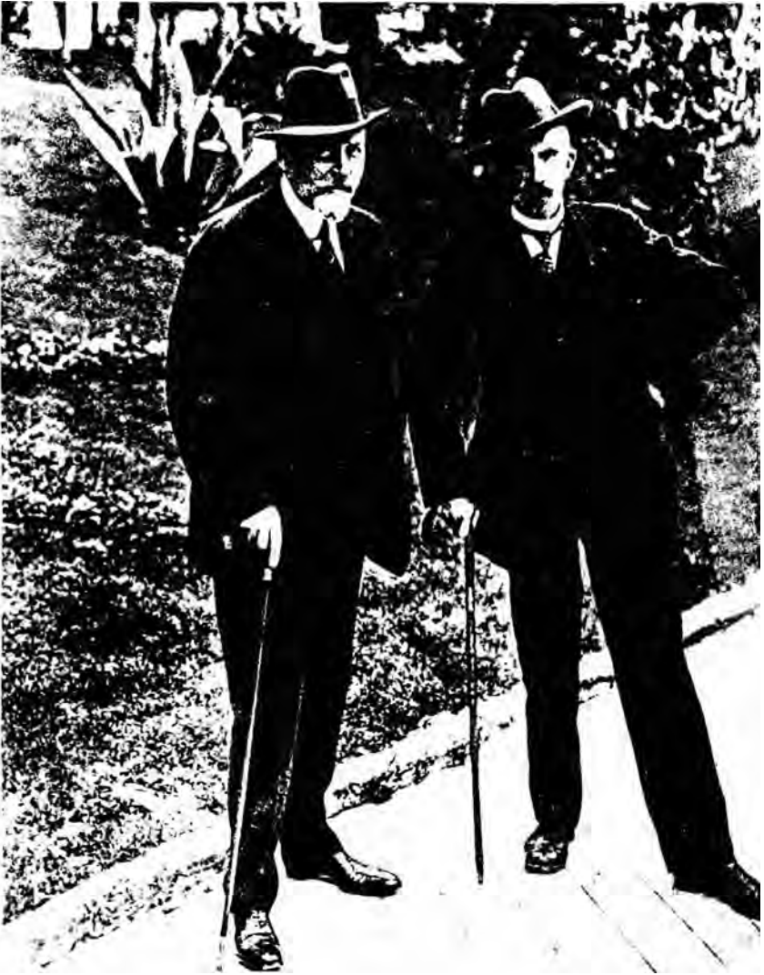
Albert Freiherr von Schrenck-Notzing (links) en Charles Richet (rechts)

dankbaar, ook al beschreef zijn zoon via het medium een leven vol aardse geneugten zoals huizen, sigaren en sterke drank. De troost die van de seances uitging was voor hem vele malen belangrijker dan de geloofwaardigheid van de details of het leveren van een bewijs.