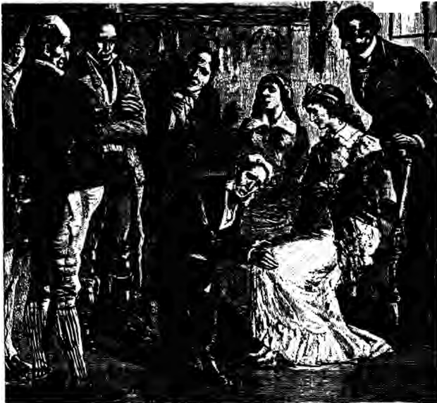
De commissie uit Buffalo aan het werk (1851)

De zusters Fox, de eerste spiritistische mediums, waren ook de eersten die zich lieten onderzoeken. Een commissie van artsen uit Buffalo werd in de gelegenheid gesteld tijdens een demonstratie met hen te experimenteren en kwam tot de conclusie dat de gezusters (sommige) geluiden met behulp van hun kniegewrichten maakten. Leah gaf toe dat de geesten verstomden indien de zusters hun